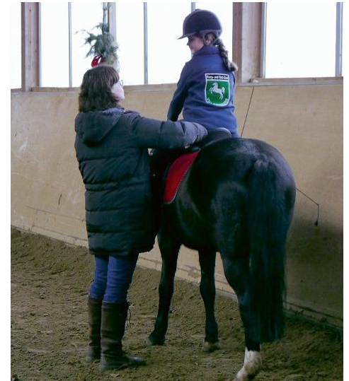
Der Fokus am ersten Lehrgangstag lag auf dem Vorreiten und dem Erfühlen der Sitzbeinknochen.

Am Samstag war am Vormittag in dreier Gruppen Dressurreiten angesagt und am späten Nachmittag/Abend haben vier Teilnehmer an der Longe zur Sitzschulung teilgenommen und 10 Teilnehmer hatten ihren Spaß beim sogenannten „Freispringen“. Das hieß nicht, dass die Pferde ohne Reiter Sprünge überwinden mussten, sondern dass die Reiter ihre Zügel zusammengeknotet hatten und somit ohne Zügel über eine Reihe von Hindernissen >