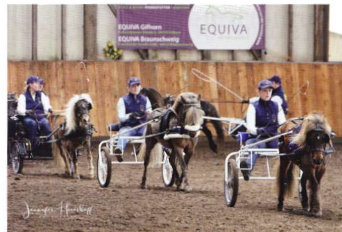
Deutsche Classic Pony Sulky-Quadrille