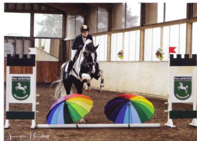
‚Söl' rings Classix Royal‘